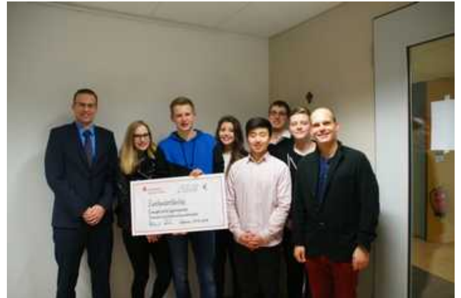
Schülervideo zum Planspiel Börse